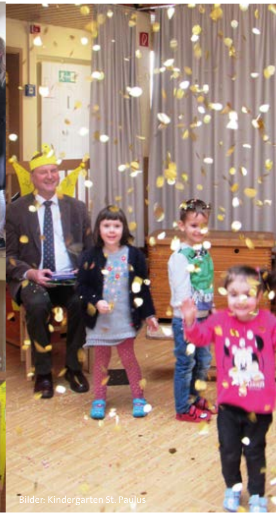
Bilder: Kindergarten St. Paulus