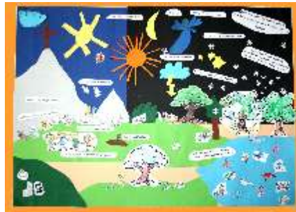
Bild oben ist im Kindergottesdienst am 14. Juni in Kösching entstanden. Es illustriert Psalm 148 und hängt in der Ladenkirche aus!

Anlässlich des Jubiläums entstand mit den Kindern, dem Elternbeirat und dem Kindergartenteam ein farbenfrohes Kochbuch mit vielen internationalen Rezepten. Das Kochbuch kann jederzeit im Kindergarten für 10 € erworben werden! Wir wünschen viel Spaß und gutes Gelingen!