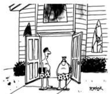
„Die beste Predigt über Opfern und Spenden, die ich je gehört habe!“

Ihre Spende ist herzlich willkommen, vielen Dank!