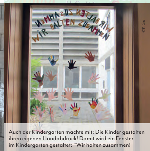
Auch der Kindergarten machte mit: Die Kinder gestalten ihren eigenen Handabdruck! Damit wird ein Fenster im Kindergarten gestaltet: "Wir halten zusammen!"