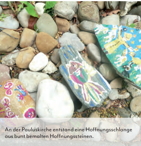
An der Pauluskirche entstand eine Hoffnungsschlange aus bunt bemalten Hoffnungssteinen.