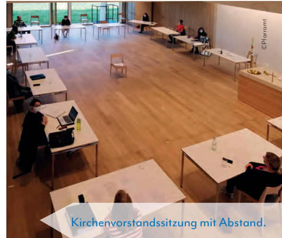
Kirchenvorstandssitzung mit Abstand.