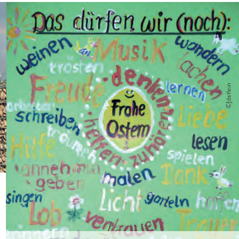
Ein Gemeindeglied gestaltete ein buntes Plakat, das zeigt, was trotz Ausgangs- und Kontaktbeschränkung alles nicht abgesagt und weiterhin möglich war.