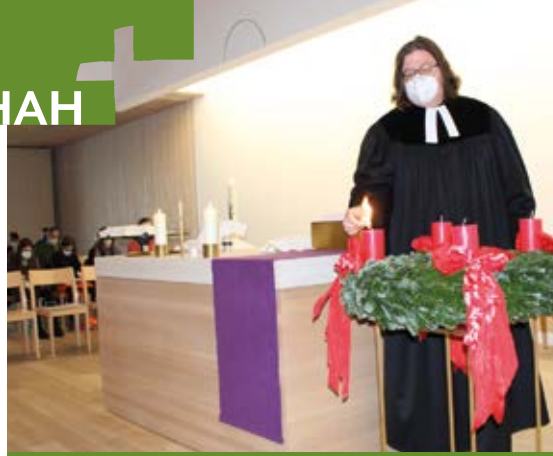
Anzünden der ersten Kerze am Köschinger Adventskranz.

In Ingolstadt feierten Kleine und Große, gemeinsam mit der Handpuppe Pauli, den Beginn der Adventszeit, der Zeit des Wartens, der Vorbereitung, Stille und Vorfreude. Unter anderem schrieben/malten die Familien, auf vorbereitete Kerzen, wie sie diese besondere Zeit verbringen. Es war ein stimmungsvoller Gottesdienst und ein wunderbarer Start in die Adventszeit.