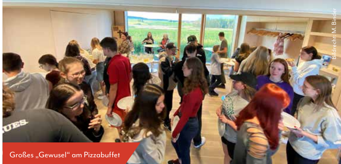
Großes „Gewusel“ am Pizzabuffet

Eine junge Mitarbeiterin meinte beim Aufräumen: „Das tat richtig gut und wir haben viel geschafft – voll super. Ich freu´ mich auf die nächsten Aktionen“.