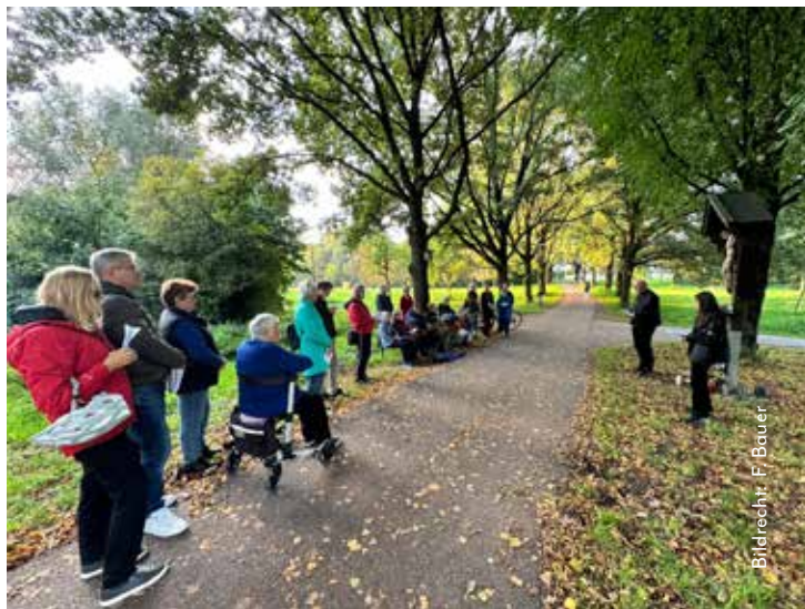
Bildrecht: F. Bauer